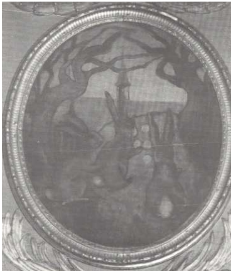
Afb. 8: Dit geschilderd medaljon, met een volkse voorstelling van het Heggewonder en Heggekapel, bevindt zich in de muur van de zitplaats van de Poederleese pastorijs.