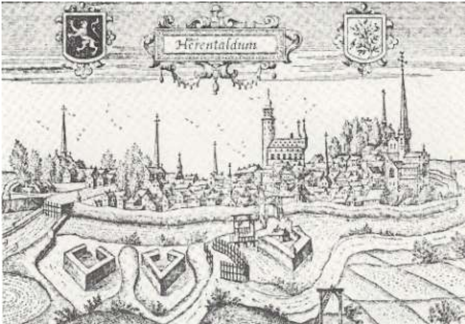
Afb. 6: Panorama op Herentals vanuit het oosten in de periode eind 16de - begin 17de eeuw. In het midden van de stedelijke omwalling merkt men de Zandpoort met op de voorgrond het galgenveld met de galg, goed zichtbaar vanaf de weg naar Lier. Hier werd na de terechtstelling het lijk van Jan vander Langensteden vermoedelijk naartoe gebracht, waar het aan de grote galg bleef hangen tot het helemaal weggerot was of verslonden door aasdiere 'ten exempele van anderen'. Gravure uit J.B. Grammage, Antverpiae Antiquitates .

verstrengde vonnis bepleitten enkele aanzienlijke Herentalse vrouwen strafvermindering bij de schout. De overste van het Herentalse gasthuis kon de gerechtsambtenaar vermurwen zodat de heiligschenner toch een snelle en minder pijnlijke dood zou sterven. Het 'verlichte' vonnis werd de volgende dag, 5 februari, uitgevoerd. De rechterhand, waarmee de kerkdief de gewijde hosties had aangeraakt, werd met een kuipersbijl afgehouden en voor diens ogen onder de galg verbrand, waarna de ongelukkige het leven liet aan de galg (13).