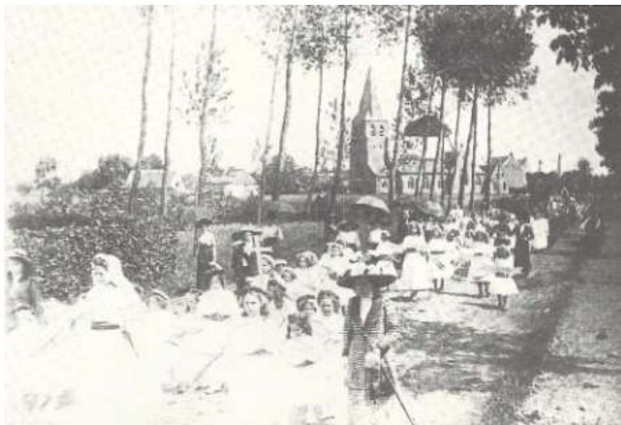
Afb. 19-22: In 1912 werd de vijfhonderdste verjaring van het Heggewonder herdacht met een groots opgezette religieuze optocht. De foto's werden genomen op de Herentalse steenweg. De pitoreske achtergrond wordt gevormd door de kerk en herberg 'In den Hemel'.