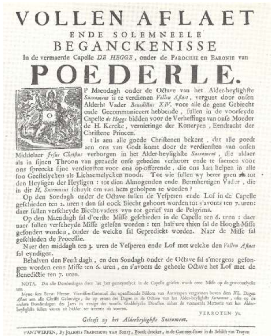
Afb. 18: Affiche die werd verspreid over de omliggende parochies om de gelovigen op te roepen om naar de begankenis van de Hegge te komen (midden achttiende eeuw - 1752?), (Eigendom van kerkbestuur Poederlee)