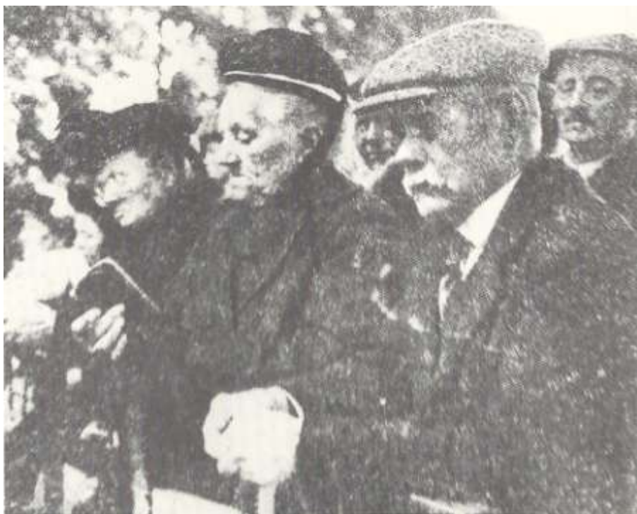
Afb. 23: Volksdevotie toen de hoogdag van de Hegge nog een louter godsdienstig feest was. Een treffende foto uit 1951.

Al van oudsher trekt op de hoogdag van de Hegge een Sacramentsprocessie van de parochiekerk naar de Heggekapel. Deze werd in 1912 wegens de vijfhonderdste viering van het Heggewonder sterk uitgebreid en aangekondigd als 'stoet'. In de jaren twintig van deze eeuw werden speciale processieklederen gemaakt die de jaarlijkse optocht meer luister