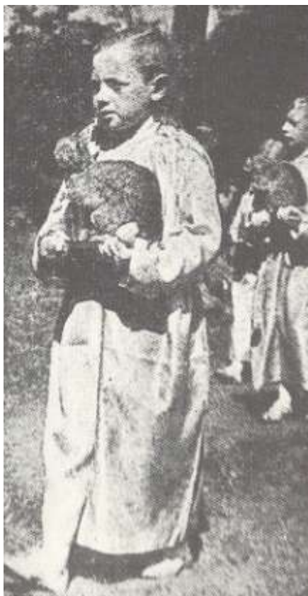
Afb. 24-29: Sfeerbeelden uit de Heggeprocessie van 1951 in het weekblad 'Ons Volk'.